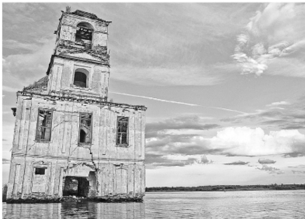
Чудом сохранившаяся церковь - зримый укор нынешнему поколению в части сохранения этого уникального символа-храма.