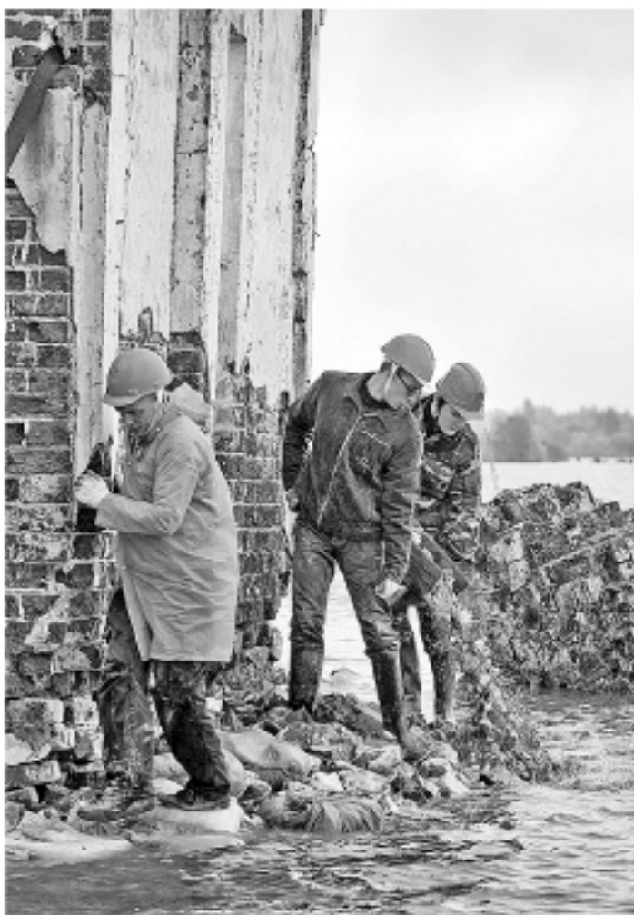
Каждый из нас может помочь волонтерам, восстанавливающим церковь в Крохино.

В уходящем 2011 году исполнилось 70 лет с момента завершения строительства каскада Верхневолжских ГЭС. В ходе грандиозных гидротехнических работ, раскинувшихся более чем на 500-километровом участке великой русской реки, были созданы новейшие по тем временам генерирующие мощности, которые обеспечили электроэнергией предприятия Центральной России, работающие на основную задачу осени 1941 года - оборону Москвы. Это стало возможным благодаря неимоверным усилиям многих тысяч заключенных, вольнонаемных, простых советских людей. В ходе работ было затоплено около 700 сел и деревень, десятки древних городов, среди которых город Молога, ставший символом Русской Атлантиды. Одновременно в обширную зону затопления вошли и береговые территории прилегающей реки Шексны, а подтопление ее истоков в районе села Крохино, близ древнего града Белоозера, сделало эту реку пригодной для крупнотоннажного паромства в водной системе, соединившей