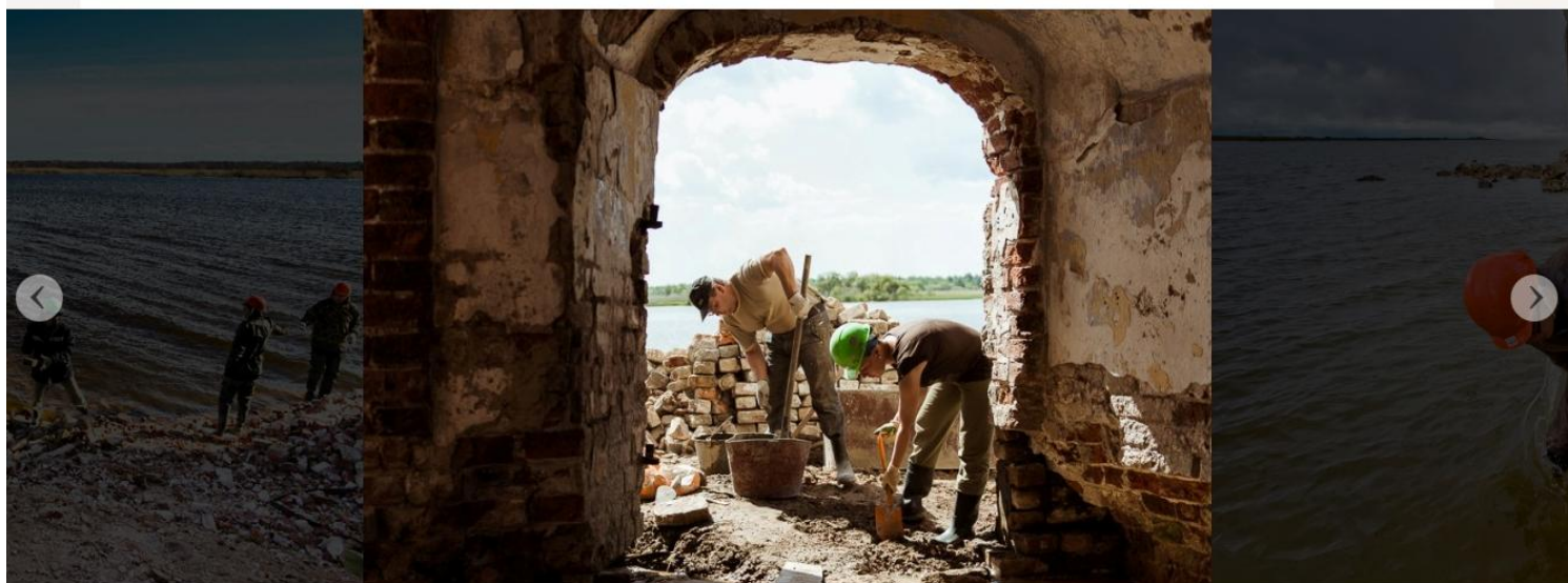
5 из 6 Восстановление кладки подмытых стен на южном участке колокольни

Раньше я работала в консалтинге, но большую часть времени всё-таки уделяла этому проекту. Когда я ушла в декрет, Крохино я не бросила, ездила туда вплоть до восьмого месяца беременности. Сейчас ребенок меня не останавливает — я понимаю, что если я этим не буду заниматься, никто не будет. Муж сначала надеялся, что всё это скоро пройдет — всё-таки странное и тяжелое увлечение для девушки. Но когда он понял, что всё серьезно, то даже получил права капитана, чтобы помогать нам с переправами.