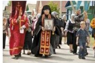
От греха до милости. Как монах-пенсионер храм спас