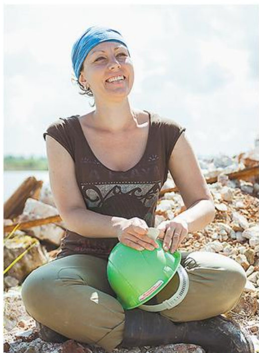
Анор: у людей нет ощущения, что они живут на своей земле.

Крохинский храм был затоплен при строительстве Волго-Балтийского канала в 1961 г., но не был снесён - сохранён в качестве маяка зоны затопления; в те годы даже защитную гряду сооружали рядом с ним. Её можно увидеть в фильме «Калина красная», где мелькает храм Рождества. После 70-х - полное забвение. Существует знаменитый рапорт, согласно которому 294 человека погибли в тех краях в годы затопления, в основном старики; некоторые выбирали добровольную смерть, предпочитая её изгнанию; их поголовно признали умалишёнными.