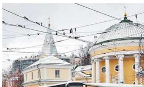
ПАМЯТНИКИ В РЕГИОНАХ